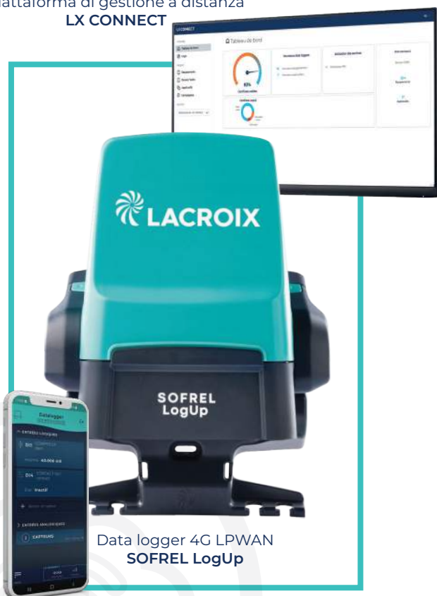
Data logger 4G LPWAN SOFREL LogUp

Piattaforma di gestione a distanza LX CONNECT