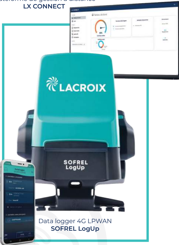
Data logger 4G LPWAN SOFREL LogUp

Plateforme de gestion à distance LX CONNECT