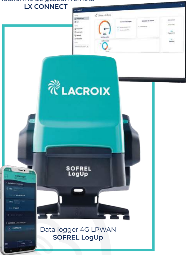
Data logger 4G LPWAN SOFREL LogUp